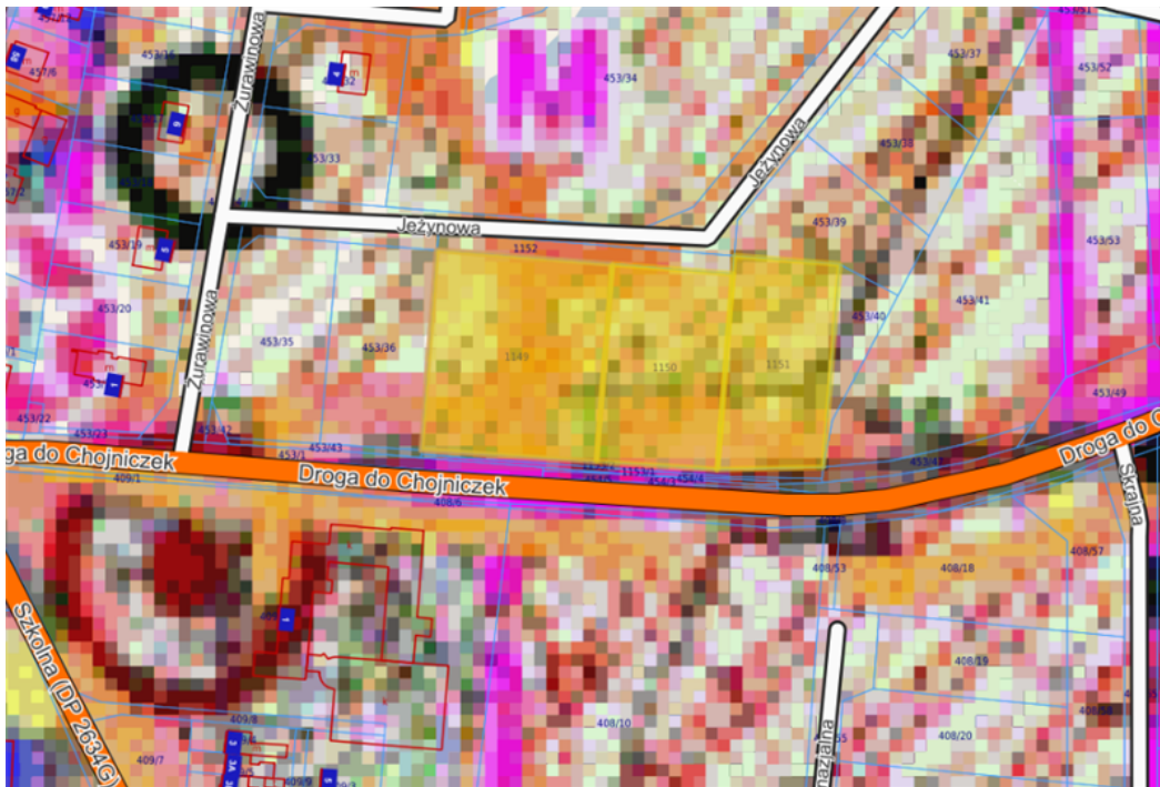
Fragment rysunku Studium uwarunkowań i kierunków zagospodarowania przestrzennego gminy Chojnice (kierunki), 2017 r.

W związku z powyższym, przeznaczenie terenu pod planowaną inwestycję nie jest sprzeczne z przeznaczeniem terenu określonym w „Studium” – teren zabudowy mieszkaniowej.